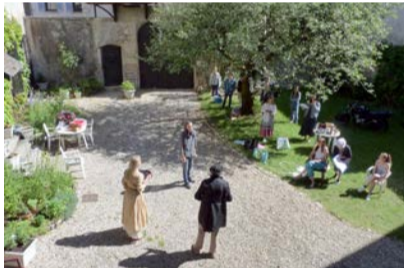
Les comédiens en répétition dans la cour qui accueillera la 1 re partie du spectacle.

Plus d'infos? Rendez-vous sur le site https://www.lesliensponcinois.fr , ou à la Maison des arts de Poncin lors des permanences, chaque lundi et samedi en matinée.